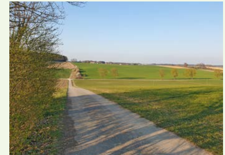
Film-Blick vom Kultberg der Rosenmüller Trilogie auf die „Beste Gegend“