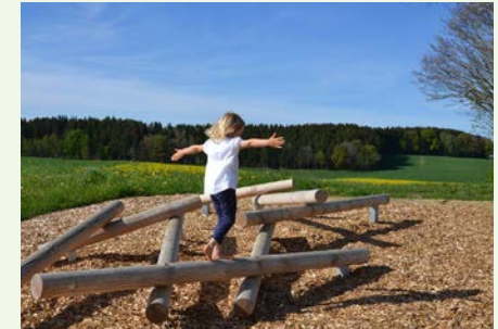
Der Balanceparcours am Daumillerberg