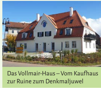
Das Vollmair-Haus – Vom Kaufhaus zur Ruine zum Denkmaljuwel