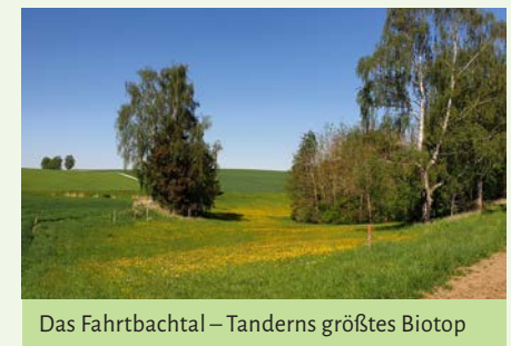
Das Fahrnbachtal – Tanderns größtes Biotop