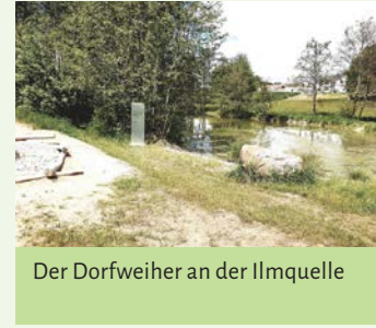
Der Dorfweiher an der Ilmquelle