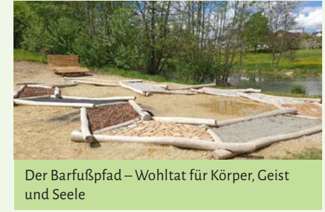
Der Barfußpfad – Wohltat für Körper, Geist und Seele